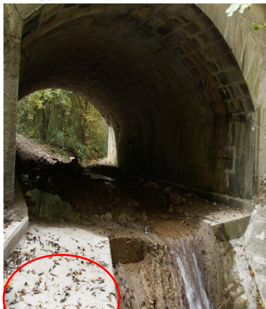
Embankment under a road