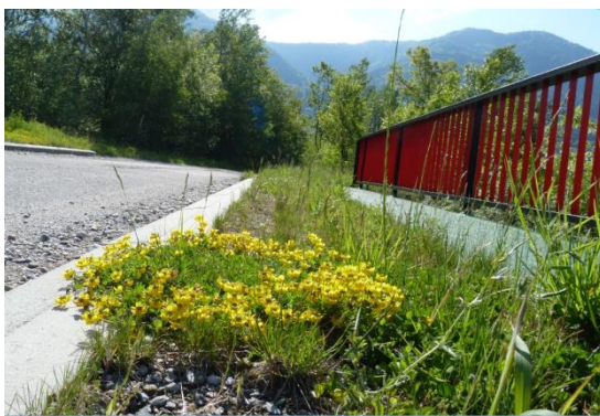
Green hedges on a bridge