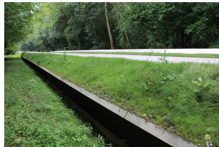
A small fauna path (specific for the green tree frog)