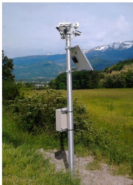
A fauna detector